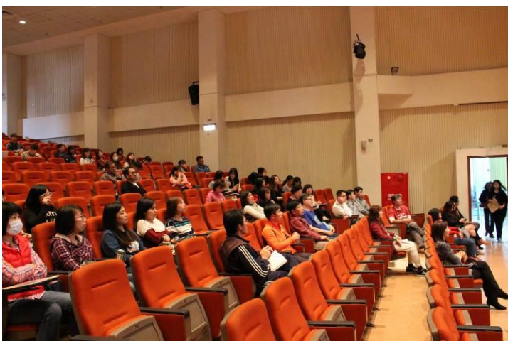
教職員工研習上課情形 02