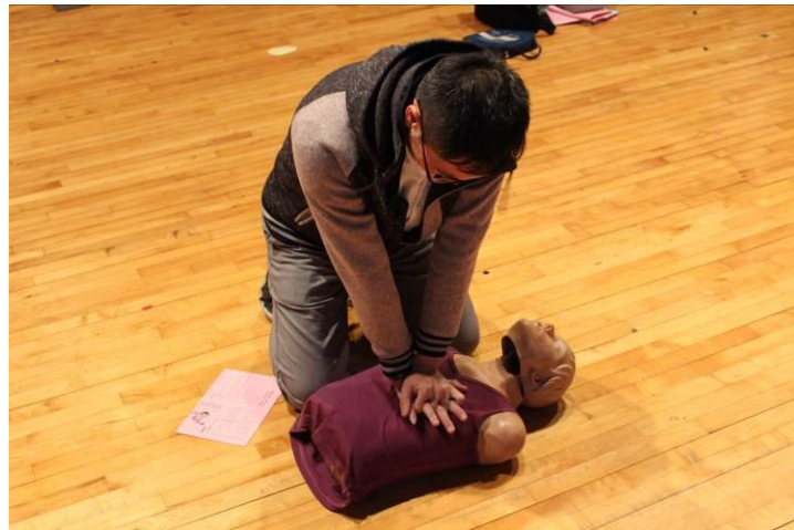
CPR 與 AED 演練 01