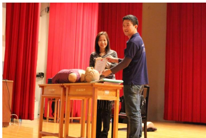
朱校長頒發感謝狀