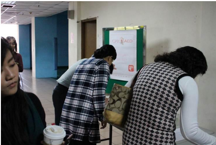
教職員工簽到情形 03