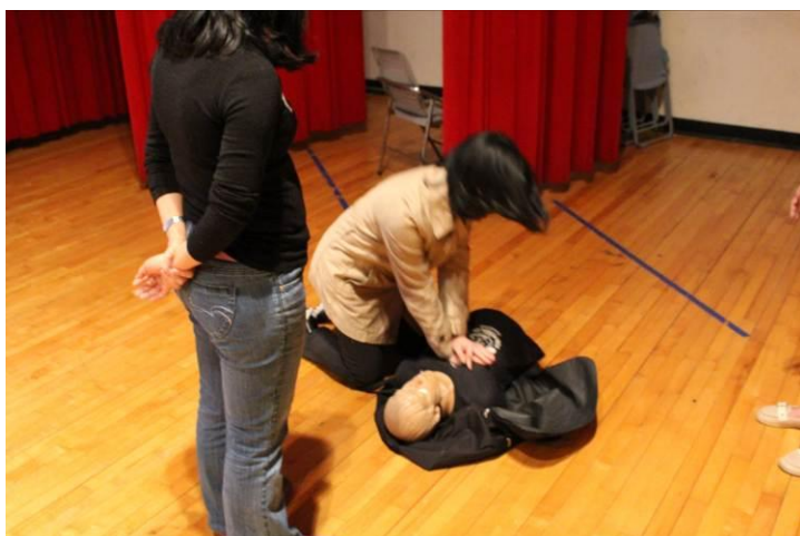
CPR 與 AED 演練 02