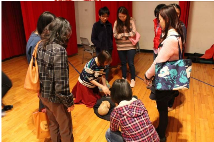
CPR 與 AED 操作示範 01

教師 CPR 與 AED 講習 106 年 3 月 28 日 活動中心三樓音樂廳