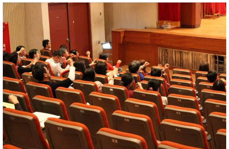
教職員工研習上課情形 03