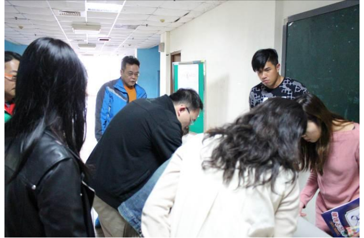
教職員工簽到情形 02