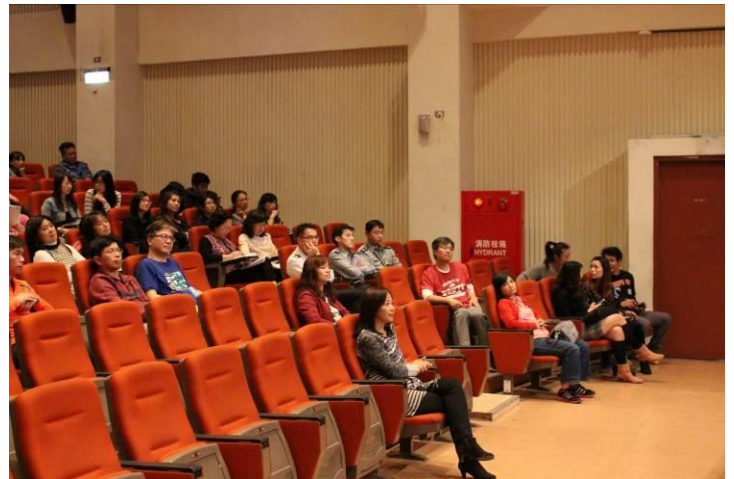
教職員工研習上課情形 01