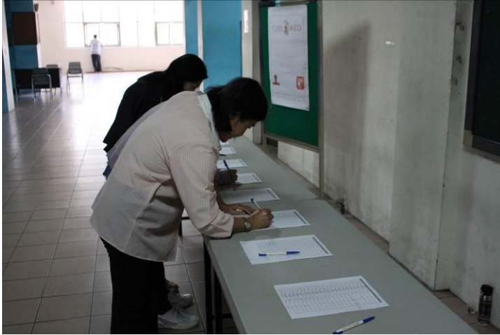
教職員工簽到情形 01