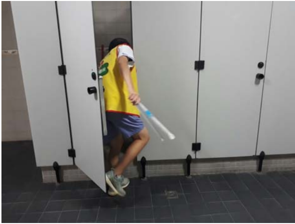
心懃青年服務隊進行廁所清掃

主題： 愛心 111 學校日物品募集活動 時間： 108 年 09 月 21 日 地點： 本校穿堂