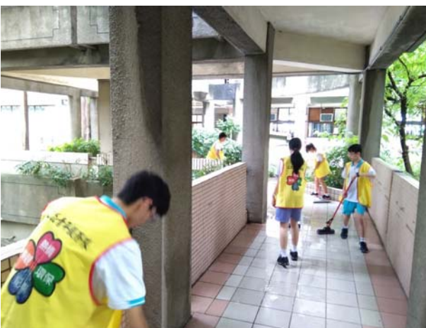
學校日適逢下雨小隊員於走廊清除積水