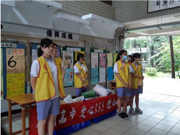
心磁青年服務隊已將現場準備妥適

主題： 愛心 111 學校日物品募集活動 時間： 108 年 09 月 21 日 地點： 本校穿堂