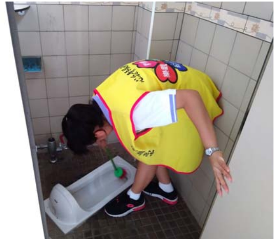
心懃青年服務隊進行廁所清掃