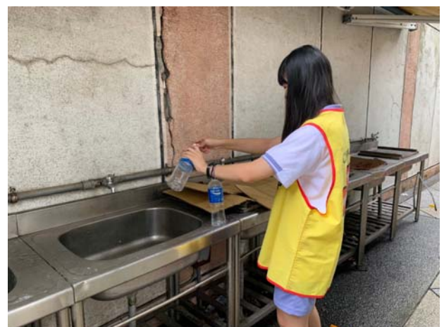
垃圾回收後進行垃圾整理