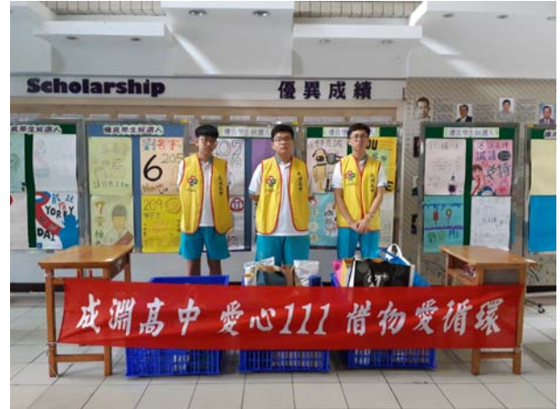
心磁青年服務隊隊員各隊輪值