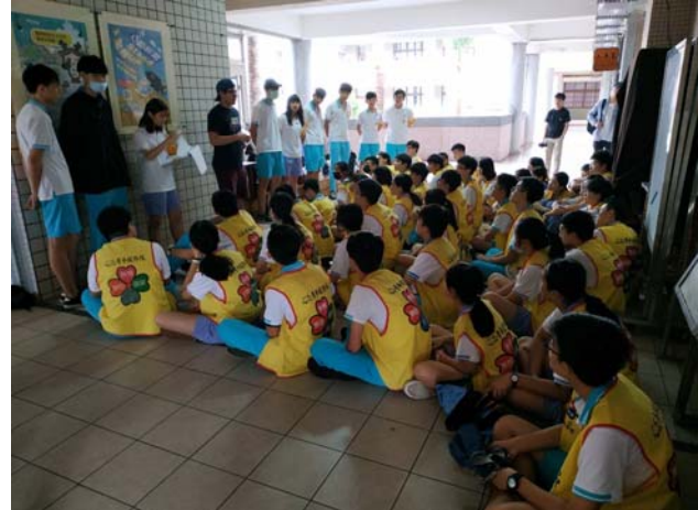
總收後組長進行勉勵