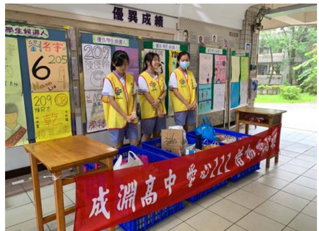
心磁青年服務隊隊員各隊輪值