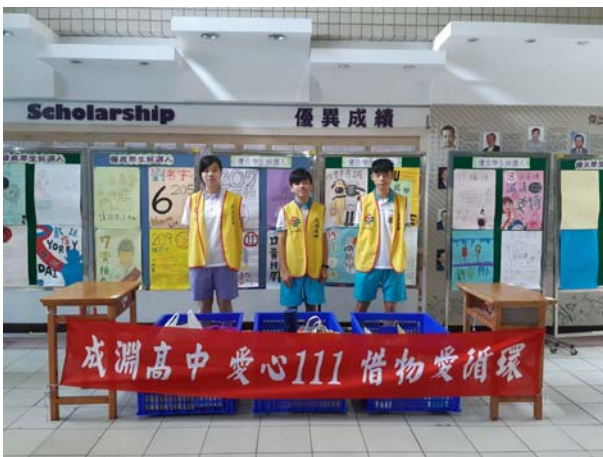
心磁青年服務隊隊員各隊輪值