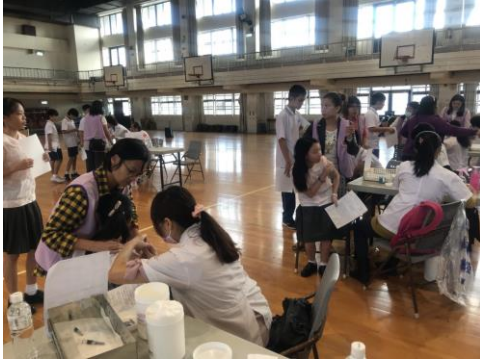
志工協助安撫學生