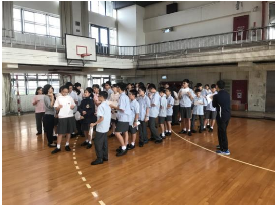
注射流感前說明注意事項

主題：國中部流感注射 時間：106 年 10 月 25 日 地點：活動中心 5 樓