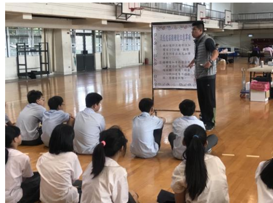
注射後說明注意事項