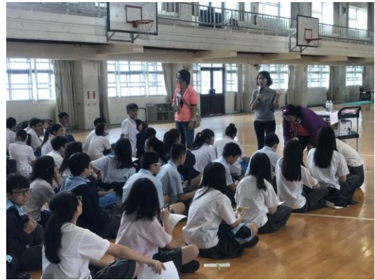
注射前確認學生狀況