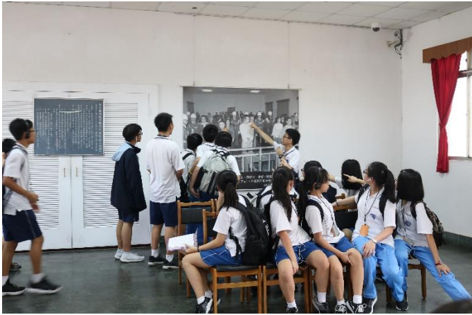
參訪軍事第一法庭

主題： 友善校園品德、法治教育- 景美人權文化園區參訪 時間： 107年4月3日 地點： 成淵高中