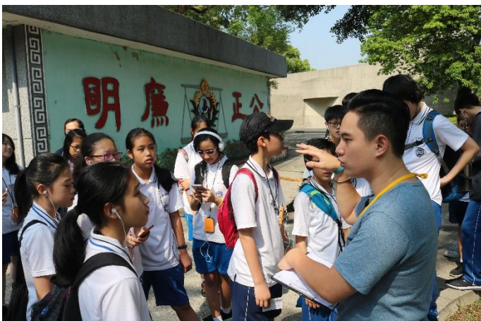
分站講師在說明文化園區過往的歷史