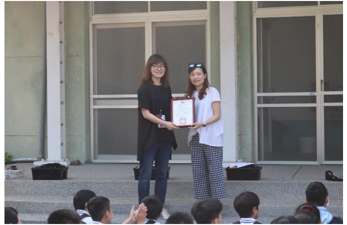
學務主任致贈感謝狀給園方