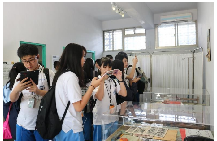
參訪受刑人的健康中心