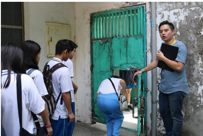
參訪受刑人關押住所