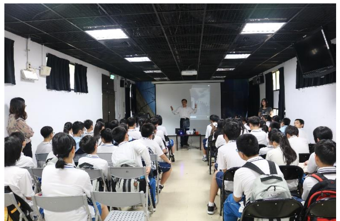
另一受難者分享親身經歷