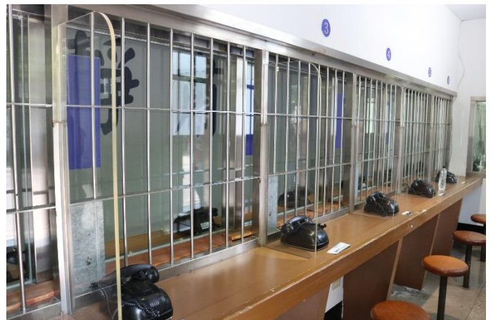
參訪受刑人與親友會面處