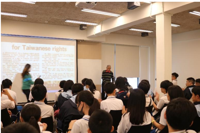
受難者現身分享親身經歷