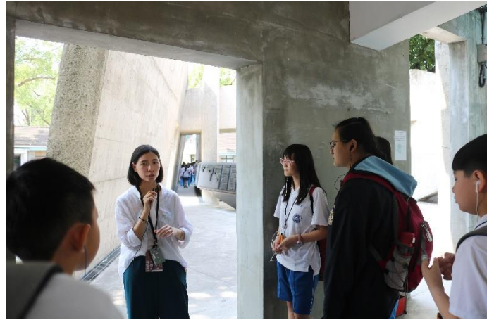
白色恐怖關押者姓名處