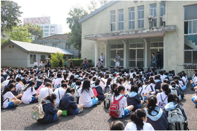
生教組長集合國七於文化園區進行參訪說明

主題： 友善校園品德、法治教育- 景美人權文化園區參訪 時間： 107年4月3日 地點： 成淵高中