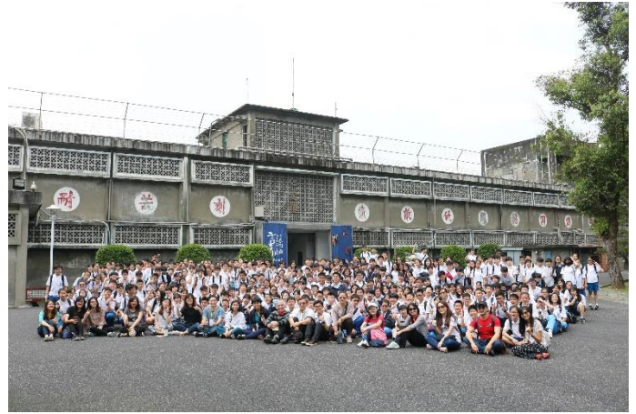
國七與園方紀念團照