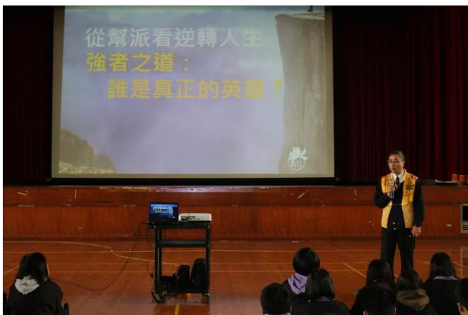
參與同學熱情回應