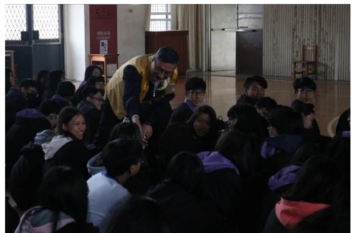
講師以互動的方式請學生分享