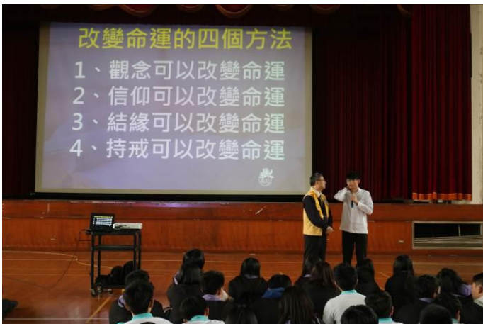
由學生主動上台分享講座心得