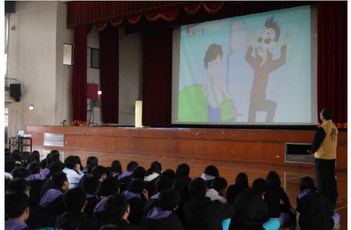
以動畫影片加深同學印象