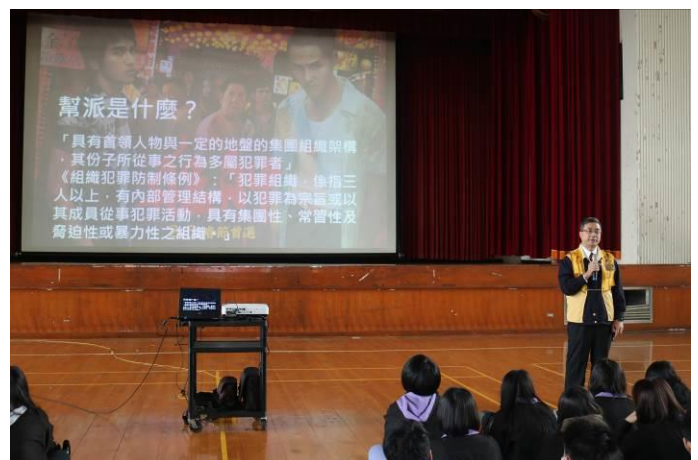
以同學了解的電影主題引發討論