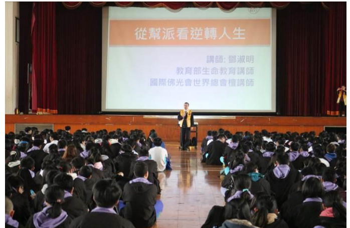
講師講座內容符合主題且貼近生活