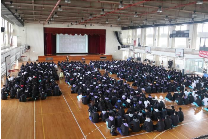
全體同學認真參與課程