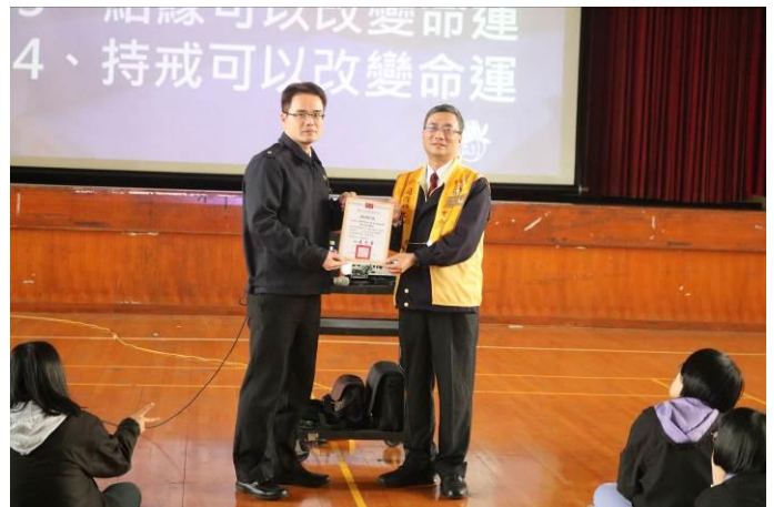
由生輔組長代表學校致贈感謝狀