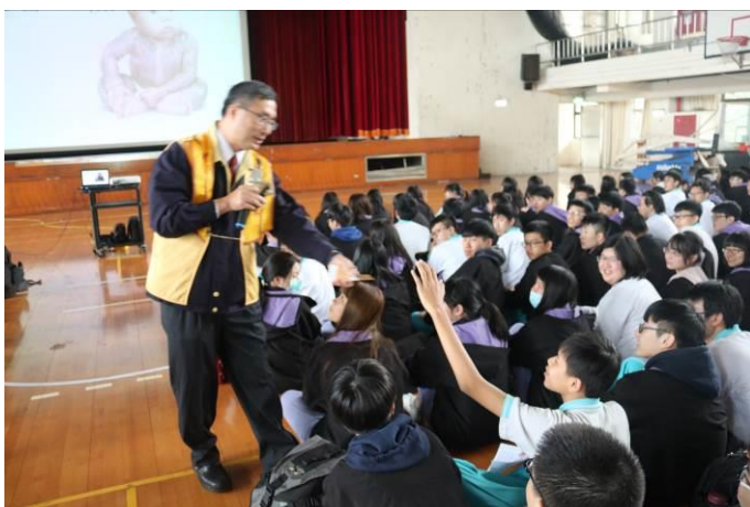
講座現場氣氛熱鬧