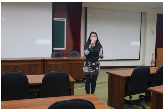
生教組長開場介紹講師