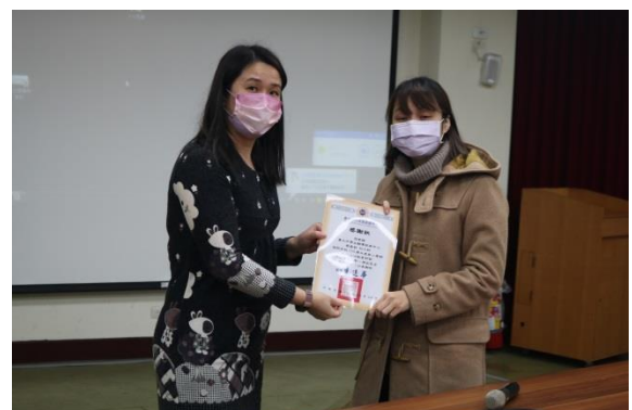
生教組長頒發感謝狀